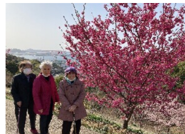
ダイヤモンドのさくらの森にて

ら天気の良い日にお花見にでかけました。外の風や日光に当たるだけでも気分もリフレッシュできます。これからチューリップや菖蒲なども見頃になります。4月5日にかけてもお花見ドライブを計画しています。感染対策を行いながら一緒に春を感じましょう。