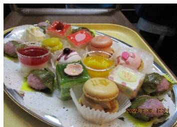
ひなまつり お菓子バイキング

ひなまつりは、「上巳の節句」の事で中国からの由来があるとされています。ケガや病などの災いを紙の人形を水に流すという厄払い風習から生まれました。現代では、子どもの祝い日としてだけではなく、思い思いに3月3日を