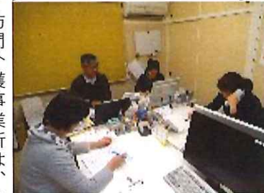
きんぎよ家の2階が事務所です！

一年を通じた、交流学習のお礼をいただききました。体験を通し、様々な感想が多く聞けました。