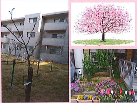
咲花が増えてきました(3/22開花)

昨年の広報誌で植樹を行った事をご紹介しました。その桜の木も大きくなってきました。まだ咲花は少ないですが、きんぎよ家皆で、成長を見守っています。公園花壇の春の苗植えも行いました。花があるととても良い気分になります。