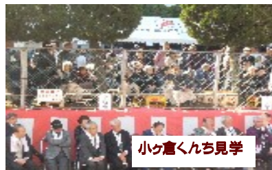
小ヶ倉くんち見学

流学習も途切れ ることはなく、 十数年たち、小ヶ 倉で育った子供 たちは皆、「きんぎょ家に行った ことがある！」という経験を積み、 成人へ…。ご利用されている利用 者様は地元になじみの方々も多く、 地域の方々の訪問や、保育園児の 訪問、地域の行事にも参加させて いただいたりと、地域の一員とし て地域の皆様に見守られながら、 共に歩んできました。これからも、 地域の方々と協働、助け合いを行 いながら、地域の拠点となってい くように努めていきます。