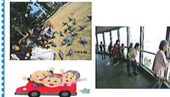
初詣諏訪神社・稲佐山・梅園等へ出かけました