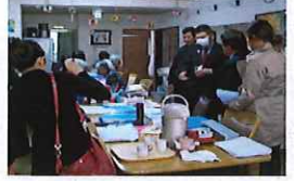
熱心に説明を聞かれていました

ます。今後、高齢化が進むと共に、入居施設や福祉サービスの事業を一〇年構想で展開していく見通しだそうです。視察団の方々はデイサービスでのサービスの様子や有料老人ホーム内のお部屋等を見学されました。檸檬のご利用者様にもこやかに手を振ったり…。交流が珍しいラオスの方と貴重なひと時を過ごしました。(三月十二日)