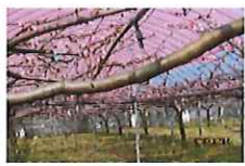
藤田尾の梅園へ行きました