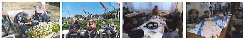
天候と体調の良いときにはお出かけ