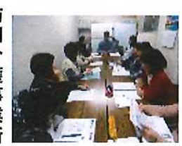
勉強会の様子(月1回開催)