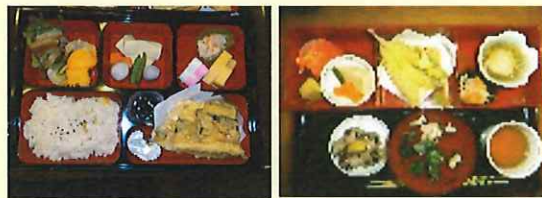
季節感を出した、行事食も充実

きんぎよ家・翌檜館では、献立は常駐の管理栄養士が立てています。食事は生活・元気の源です。出汁にこだわり、添加物のない手作りの調理で美味しさを心がけています。また、きんぎよ家・翌檜館は対面キッチン（台所）でお料理を作っています。香りや音等の五感で時間を感じながら、作る方とのコミュニケーションも図れるところも魅力のひとつです。栄養士も普段の調理にも携わりながら、ご利用者様の状態把握に努めています。単にお料理をお出しするだけでなく、生活の中で食事を感じて