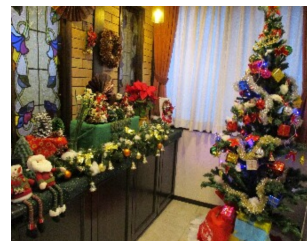
季節ごとのエントランス

②心肺蘇生法についての演習③AEDの使い方の講習を受けました。退勤後の時間ではありましたが、介護職員・看護職員の多くの参加があり皆で真剣に取り組みました。日ごろの仕業務内に限らず、日常生活において救命救急の知識があることは、とても役に立つことです。緊急時に誰もが対応を行えるように、確認の意味でも改めて講習を行えたことは良かったです。今後も、グループ内で様々なテーマに取り組み、業務に活かしていきます。