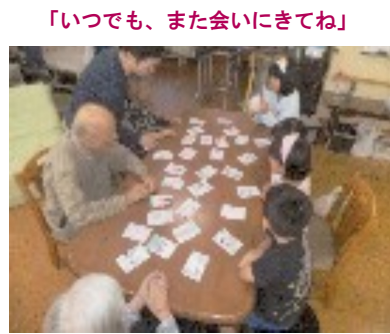
「いつでも、また会いにきてね」