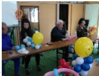
手先と頭を使います! 皆さん真剣

「上揚ふれあいサロン」にてバルーンアートの講習を行ってきました。初体験の方ばかりでしたが、皆さん集中して、四作品をつくりあげました。途中、風船が割れるハプニングも...バルーンアートは年齢問わずに楽しめます。風船は見るだけでもウキウキします。また伺います。