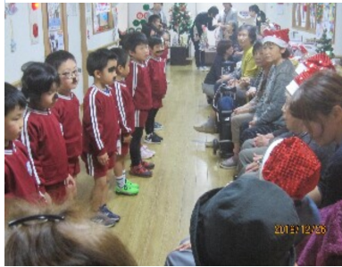
♪~♪~ 楽しいクリスマス

デイサービスミントの店舗では、毎週土曜日限定の「カフェ」を行っています。野菜の販売や、休憩・喫茶スペースにて珈琲などの飲み物を提供しています。地域の皆様にとんどん活用していただきたいです。どうぞお気軽にお立ち寄りください