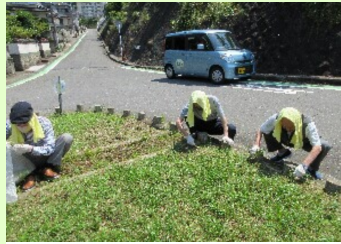
男性方、手際よく無心に除草中

小ヶ倉二丁目自治会 小ヶ倉ご利用者様が毎日交代で通い、意欲的に取り組み、雑草を綺麗に抜いてくださいました。作業中も地域の方々の見守りや事業所へ訪ねてきて下さったりと、ご配慮いただいています。これからも地域活動にご協力していきます。