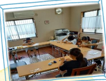
夏休み講座 工作教室

毎年恒例になってきました。夏休み講座。習字教室は市内の小学生 10名が参加しました。1日無料での講習は毎年人気です。