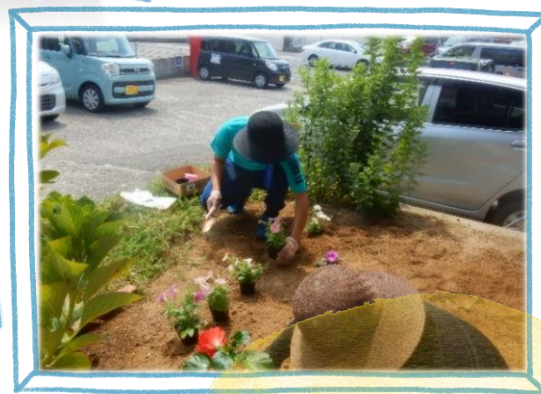
ボランティア活動 受け入れ

地域の小ヶ倉小学校の4年生との交流福祉学習は、きんぎょ家創立以来、毎年続いています。今年度は施設内にお招きすることができませんでしたが、地域包括支援センターの方々と協働して「認知症サポーター養成講座」を開催しました。地域を支える一員として頼もしい学習風景でした。