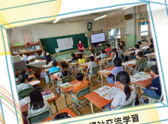
小学生 福祉交流学習

工作教室も毎年実施。感染症対策をしておこないました。毎年、記念に残る作品ができます。