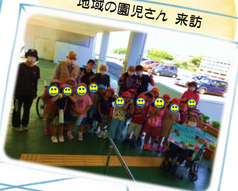
地域の園児さん 来訪

今年度は、事業所内でご利用者様と関りができませんでしたでしたが、外での交流となりました。可愛い声と笑顔に癒されます。来てくれてありがとうございます。